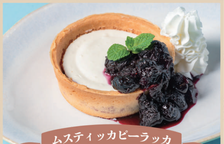
ムスティッカピーラッカ

お酒と一緒に楽しむ地中海料理のひとつです。揚げたり茹でたりした白身魚を、オイルやビネガーを合わせた漬け汁に漬け込んで作ります。寒い地域でよくとれるニシンを使用しました。