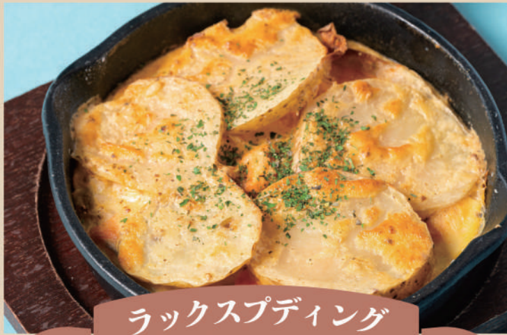
ラックスプディング

19世紀にいたエーリク・ヤンソンという宗教家の話。絶対に肉や魚を口にしない菜食主義者の彼は、ある日このカリッと焼けた美味しそうな料理を見て激しく心が揺れて、ついに信者たちを見捨ててこっそりと食べたという話です。じゃがいもとアンチョビのグラタン。