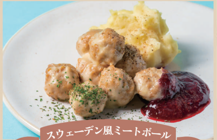
スウェーデン風ミートボール

スウェーデンの伝統的な家庭料理ラックスプディングを紹介します。プディングといってもお菓子ではありません！スウェーデン料理でよく使われる食材の、生サーモン・ジャガイモ・ディルを重ねて卵液をかけ、オーブンで焼くだけのクリーミーなグラタン料理です。